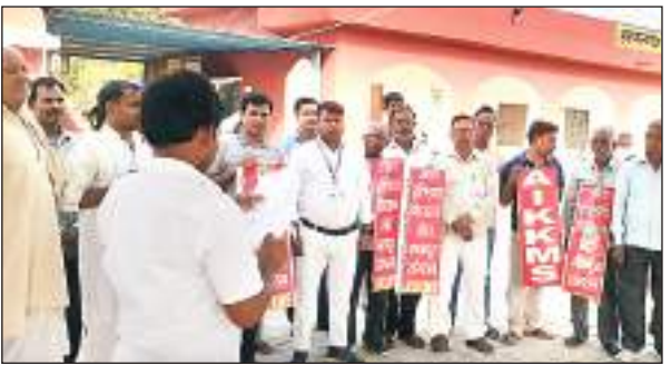
हरपालगंज स्टेशन पर प्रदर्शन करते लोग

प्रदर्शन को संबोधित करते हुए वक्ताओं ने कहा कि उत्तर प्रदेश में वाराणसी से सुल्तानपुर पैसेंजर ट्रेन नं. 4263 और सुल्तानपुर से वाराणसी पैसेंजर ट्रेन नं. 4264 और 4265 व