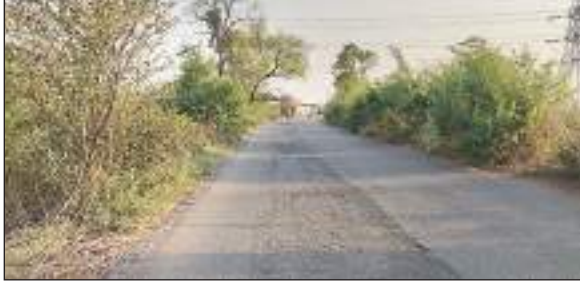
चकिया-चंदौली मार्ग के दोनों ओर उगे झाड़-झंखाड़।

शहाबगंज। चकिया चन्दौली मार्ग के पटरियों पर उगे झाड़ झंखाड़ परेशानी का सबब बनते जा रहे हैं। वहीं पीडब्ल्यूडी विभाग झाड़ी कटवाने के प्रति लापरवाह बना हुआ है। चकिया से चन्दौली जाने वाला 30किमी का मार्ग लेप्ट कर्मनाशा नहर के किनारे बना हुआ है। उसी मार्ग के द्वारा छोटे बड़े वाहनों का आवागमन होता है।