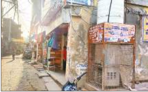
चंदौली नगर के पुरानी बाजार में खराब पड़ा वाटर कूलर।

चंदौली। मुख्यालय स्थित विभिन्न स्थानों पर लगाए गए वाटर कूलर खराब हो चुके हैं। इससे मुख्यालय पर रोजाना आने जाने वाले सैकड़ों लोगों को शुद्ध पानी के लिए काफी परेशानी झेलनी पड़ती है। लोगों का कहना है कि जिला प्रशासन व नगर पंचायत प्रशासन की ओर से तत्काल शुद्ध पेयजल के लिए वाटर कूलर हेंडपंप की व्यवस्था की जाए, ताकि लोगों को शुद्ध पेयजल उपलब्ध हो सके। यही नहीं कबाड़ हुए वाटर कूलर नगर पंचायत की शोभा बढ़ा रहे हैं। नगर पंचायत अध्यक्ष की मानें तो जल्द ही इस व्यवस्था को बहाल की जाएगी ताकि लोगों को राहत मिल सके। जिला मुख्यालय पर प्रतिदिन हजारों लोगों का आवागमन होता है, लेकिन उन्हें शुद्ध पेयजल के लिए इधर-उधर