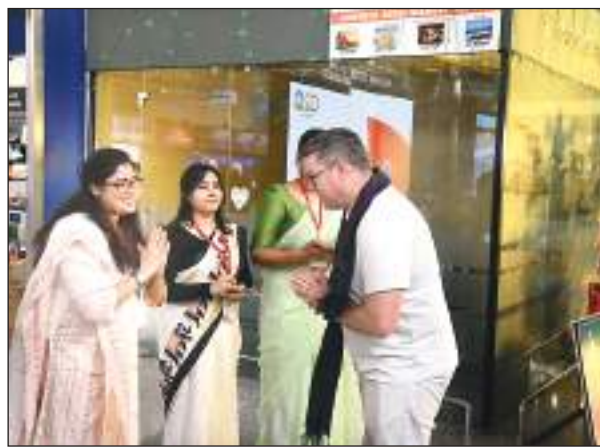
विदेशी मेहमानों का तिलक लगाकर स्वागत करती अधिकारी

एयरपोर्ट पर सनातनी परम्परानुसार सभी विदेशी मेहमानों का तिलक व माला पहनाकर हुआ भव्य स्वागत होटल तक सांस्कृतिक दलों ने चौराहों पर किया भव्य स्वागत भव्य काशी दिव्य काशी की दिखी झलक