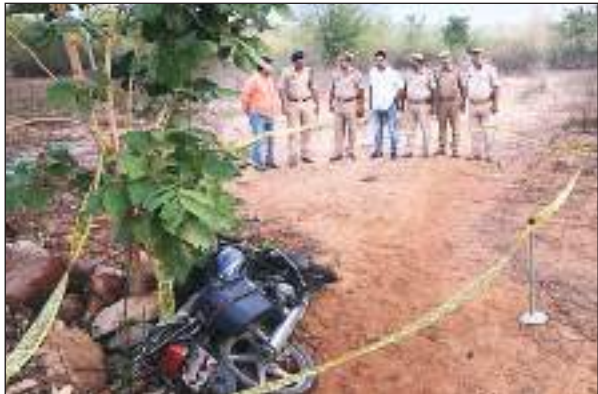
मुठभेड़ के बाद मौके पर टीम

मीरजापुर। राजगढ़ थाना पुलिस ने भभुआ बिहार निवासी 25 हजार के इनामिया गो-तस्कर को गोली मारकर उसके घायल होने पर गिरफ्तार किया। बदमाश और पुलिस के बीच रविवार की सुबह करीब सवा 4 बजे मुठभेड़ हुई। बदमाश के दाहिने पैर में गोली लगी है। उसे राजगढ़ प्राथमिक स्वास्थ्य केंद्र