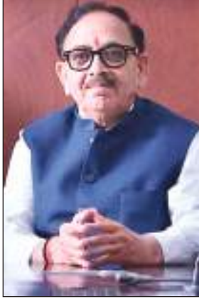
केंद्रीय मंत्री डा. महेंद्रनाथ पांडेय।