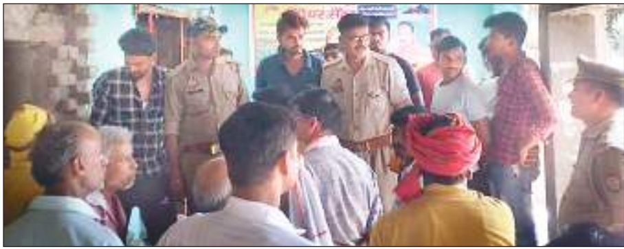
चोरी के बाद जांच-पड़ताल करती पुलिस