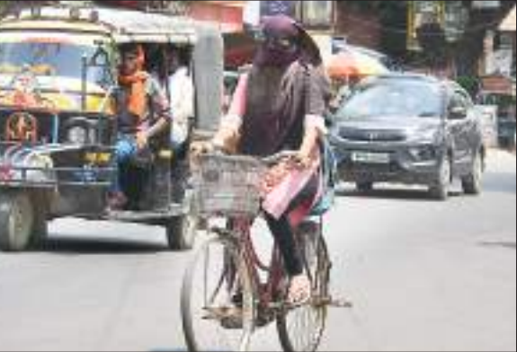
चिलचिलती धूप में घर की तरफ जाती युवती