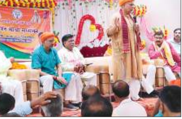
कार्यक्रम को संबोधित करते सांसद वीरेन्द्र सिंह मस्त

उन्होंने सरकार की उपलब्धियों पर विस्तार से चर्चा की। कहा कि बिना जाति-धर्म और व्यक्ति को ध्यान में रखे देश हित एवं पार्टी हित में भाजपा को मजबूत बनाने के लिए हमें कार्य करना है। इसके लिए हम सबको मिलकर कार्य करना होगा। कहा कि कुछ लोग ऐसे होते हैं, जिनका मनपसंद उम्मीदवार नहीं होने पर वह पार्टी की मदद में नहीं लगते हैं। ऐसे लोग बहुत समय तक किसी एक दल में नहीं रहते हैं और सम्मान भी नहीं पाते हैं। उन्होंने विकास कार्यों की चर्चा करते हुए कहा कि बलिया संसदीय क्षेत्र में 200 से अधिक सड़कें बन रही हैं। जनता-जनार्दन को चाहिए कि उन सड़कों के मानक पर पैनी नजर रखें। अगर मानक का उल्लंघन हो रहा हो तो कार्य रोक दें। कहा कि सरकार की योजना है कि देश के हर