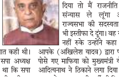
आपके (अखिलेश यादव) द्वारा पाले पोसे गए माफिया को मुख्यमंत्री योगी आदित्यनाथ ने टिकाने लगा दिया है। चुनाव के बाद आपकी पार्टी भी टिकाने लग जाएगी। सांसद के ट्वीट के बाद मैनपुरी की राजनीति गरमा गई है।

राज्यसभा सांसद हरनाथ सिंह ने उन्हें करारा जवाब दिया है। सांसद ने ट्वीट कर लिखा कि उत्तर प्रदेश की 80 सीट पर जीत के दावे तो छोड़ ही दीजिए। आप केवल एक लोकसभा सीट डाली। उन्होंने ट्वीट किया कि अगर अखिलेश वाराणसी सीट जीतकर दिखा दें तो वह राजनीति से संन्यास ले लेंगे। दरअसल अखिलेश ने यूपी में सपा के 80 सीटें जीतने का बात कही थी। सीतापुर में रविवार को सपा अध्यक्ष अखिलेश यादव ने कहा था कि सपा लोकसभा चुनाव में प्रदेश की सभी 80 सीटों पर जीत हासिल करेगी। इस पर मैनपुरी जिले के गांव गोपालपुर निवासी