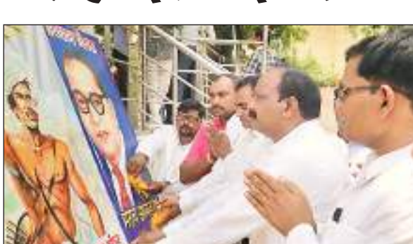
बिरसा मुण्डा को श्रद्धांजलि अर्पित करते लोग।