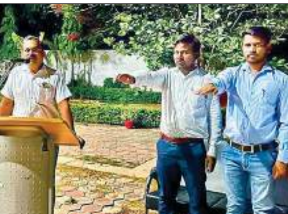
पर्यावरण संरक्षण की शपथ लेते लोग

रेणुकूट। नगर स्थित ग्रीनलैंड स्कूल परिसर में जल संरक्षण पर एक संगोष्ठी का आयोजन किया गया। कार्यक्रम में प्रवृद्ध जनों ने गिरते भूजल स्तर पर गहरी चिंता जताई। समस्या के निदान के लिए जन जागरूकता और जन सहभागिता पर जोर दिया गया।