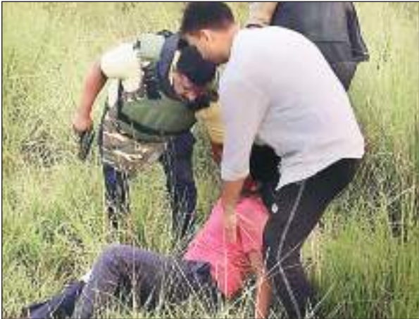
पुलिस की गोली से घायल बदमाश।