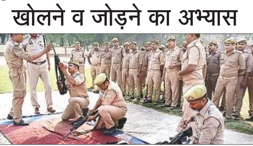
अभ्यास करते पुलिस के जवान