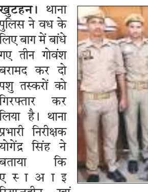
गिरफ्तार पशु तस्कर व पुलिस टीम