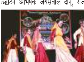
कैंप के समापन पर नृत्य प्रस्तुत करती बच्चियां।