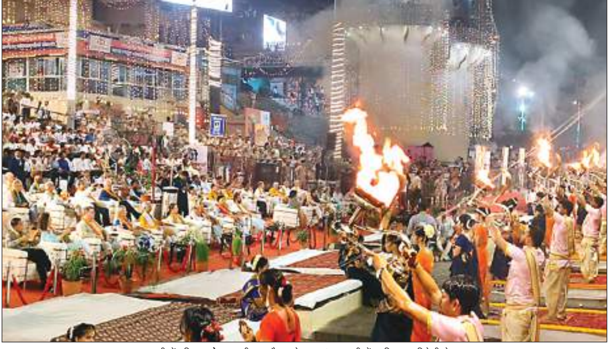
वाराणसी में रविवार को शुरू जी-20 बैठक के बाद गंगा आरती में शामिल हुए विदेशी मेहमान।

नई दिल्ली। कनाडा में फर्जी दखिला पत्रों का उपयोग करके वीजा प्राप्त करने के आरोप में निर्वासित किए जाने के डर से जुड़ा रहे कुछ भारतीय छात्रों को कनाडा के अधिकारियों से स्थगन आदेश मिला है। सूत्रों ने यह जानकारी दी। भारत कनाडा के अधिकारियों से निष्पक्षता बरतने और मानवीय दृष्टिकोण अपनाने का कई बार आग्रह कर चुका है क्योंकि छात्र कथित रूप से कुछ एजेंट की धोखाधड़ी का शिकार हुए थे। सूत्रों ने यह भी कहा कि जिन भारतीय छात्रों को कनाडा से निर्वासित किए जाने की आशंका है, उनकी वास्तविक संख्या 700 से कम है। एक सूत्र ने कहा इनमें से ज्यादातर छात्र 2017-2019 के दौरान कनाडा गए थे। अपनी पढ़ाई पूरी करने के बाद, उनमें से कुछ ने कार्य अनुमति प्राप्त की, जबकि अन्य ने कनाडा में पढ़ाई जारी रखी। भारत कनाडा और नयी दिल्ली में कनाडा के अधिकारियों के समक्ष इस मामले को उठाता रहा है। विदेश मंत्री एस जयशंकर ने भी कनाडा के अपने समकक्ष से इस मामले पर बात की थी।