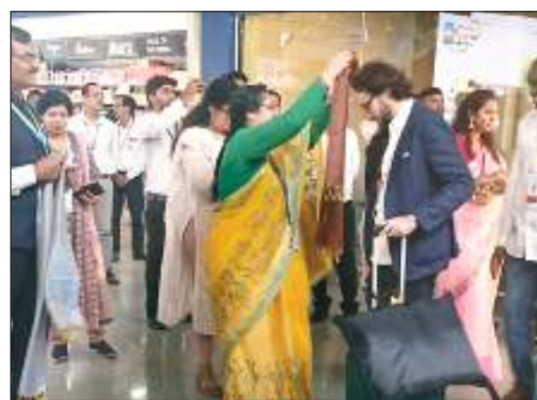
विदेशी डेलिगेट का किया गया भव्य स्वागत

से लेकर नदेसर स्थित ताराकित होटल (जहां विदेशी मेहमान ठहरे हैं) तक सड़क के दोनों छोर सहित प्रमुख चौराहों व तिराहों पर सांस्कृतिक दलों की ओर से दिखाये जाने वाली काशी की झलक को विदेशी मेहमानों ने निहारा। लगभग बीस किलोमीटर की इस दूरी पर हर स्थानों पर स्वागत के लिए लोग खड़े रहे। प्रमुख चौराहों पर भी डमरु दलों के लोगों ने एक परिधान में डमरु की ध्वनि से पूरे माहौल को अद्भूत किया। होटल