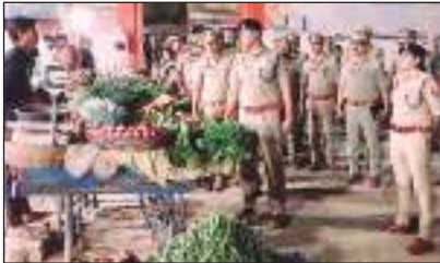
सब्जी विक्रेता से वार्ता करते कप्तान

गहनता से चेकिंग करायी गयी। अतिक्रमण करने वालों के विरुद्ध आवश्यक कार्यवाही का निर्देश दिया। सिविल लाइन तिराहा से गुजरते समय सिटी क्लब में फल और सब्जी के लगे दुकानों पर जाकर लोगों का कुशलक्षेम जाना। कुछ समय पूर्व यही