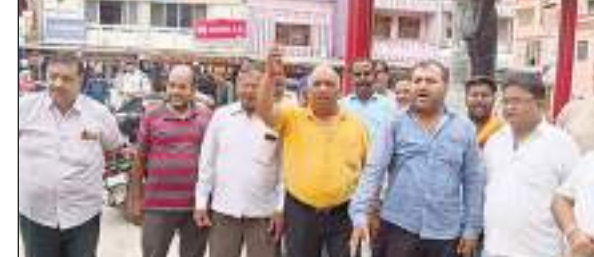
नारेबाजी करते व्यापारी

गुस्सा दो दिनों के अंदर बिजली व्यवस्था नहीं सुधरी तो व्यापारी प्रतिष्ठान बंद कर करेंगे आंदोलन