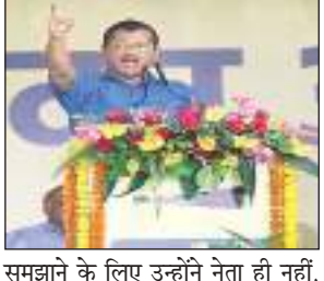
समझाने के लिए उन्होंने नेता ही नहीं, बल्कि वरिष्ठ अधिकारी कपिल सिब्बल को बुलाया और उन्होंने इसे बारीकी से समझाते हुए इसे केंद्र सरकार का गलत निर्णय कहा।

नई दिल्ली। आम आदमी पार्टी ने केंद्र सरकार के अध्यादेश लाने के निन्दित खिलाफ रविवार को रामलीला मैदान में महारौली करके शक्ति प्रदर्शन किया। इस दौरान आप नेताओं ने दिल्ली के संबंध में भाजपा की केंद्र सरकार के रुख को लेकर कड़ी नाराजगी जताई। आप संयोजक और दिल्ली के मुख्यमंत्री अरविंद केजरीवाल केंद्र सरकार पर जमकर हमलावर रहे। उन्होंने कहा कि 12 साल पहले हम इसी रामलीला मैदान में भ्रष्टाचार के खिलाफ इकट्ठा हुए थे और आज यहां एक अहंकारी तानाशाह को इस देश से हटाने और तानाशाही को खत्म करने के लिए इकट्ठा हुए हैं। उस समय भ्रष्टाचार के खिलाफ हमारा आंदोलन सफल हुआ था। अब वैसे ही देश से तानाशाही