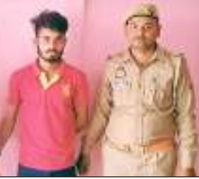
बलुआ पुलिस की गिरफ्त में वांछित।