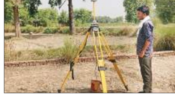
चुनुगपार में रेल लाइन के लिए सर्वे करता सर्वेयर।

शासन ने नई लाइन बिछाने के लिए अंतिम लोकेशन सर्वेक्षण के लिए बजट की स्वीकृत दी है। इसकी प्रत्याशित लागत चार करोड़ 89 लाख 80 हजार रुपये है। इस वित्तीय वर्ष के लिए एक करोड़ रुपये स्वीकृत किए गए हैं वहीं वर्ष 2023-24 में 1.27 करोड़ रुपये खर्च किए जाएंगे। सर्वेक्षण पूरा करने के लिए दो करोड़ 62 लाख 80 हजार रुपये खर्च किए जाएंगे।