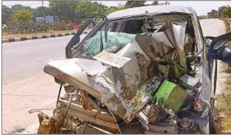
दुर्घटना में क्षतिग्रस्त हुई कार