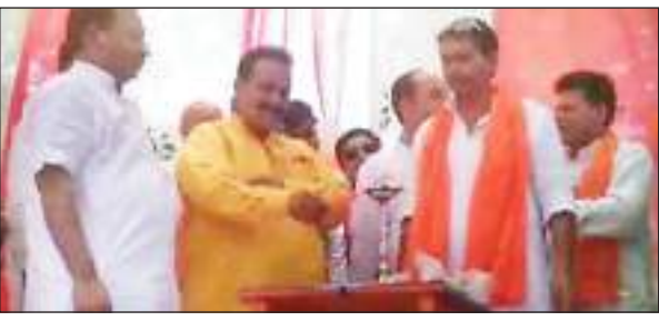
दीप प्रज्वलित कर कार्यक्रम का उद्घाटन करते नेतागण।

महराजगंज (आजमगढ़)। प्रधानमंत्री नरेंद्र मोदी के नेतृत्व में केंद्र सरकार के नौ वर्ष पूर्ण होने के अवसर पर स्थानीय खण्ड विकास में लाभार्थी सम्मेलन का आयोजन किया गया।