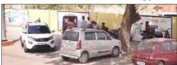
चौकी पर बैठकर वसूली करते दबंग

मीरजापुर। रेलवे स्टेशन मीरजापुर में टेंडर निरस्त होने के बाद भी वाहन मालिकों से अवैध वसूली की जा रही है। अवैध विभाग की मिलीभगत कहा जाए या ठेकेदार की गुंडागर्दी। स्टैंड रेलवे स्टेशन पर वाहन ले जाने के बाद आपको पैसा हर हाल में देना पड़ेगा टेंडर निरस्त हो या नहीं इसके लिए जिम्मेदार कौन है। यात्रियों को स्टैंड के मालिक द्वारा जबरदस्ती वसूली